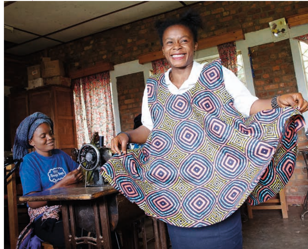
En av eleverna visar stolt upp klänningen som hon arbetar med.